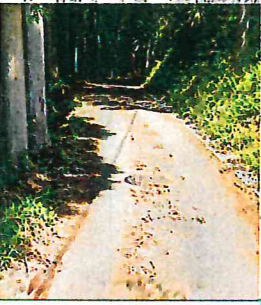
下山知野辺線(知野辺) L=10m、W=3m C=1,000千円