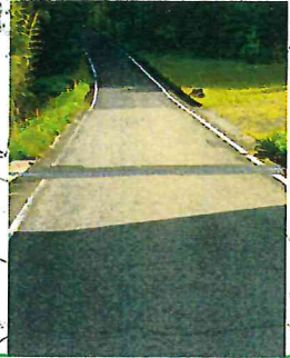
升谷大迫線(升谷) L=10m、W=5m C=900千円